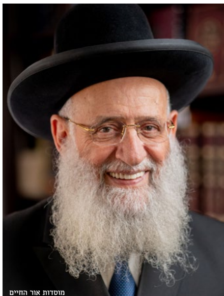
מוסדות אור החיים

הגאון רבי ראובן אלבו שליט"א על דרכי השידוך של יצחק אבינו