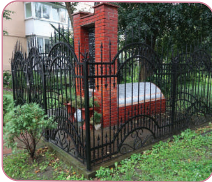
כתב את ספרו מתוך הדחק. קברו של בעל 'קצות החושן'

"תשמע", פנה ר' יעקב לר' אריה ליב "על פניו דברך נראים נפלאים ממש, אולם לפני שאני עובר על הכל אני לא יכול לתת את הסכמתך, בבקשה ממך גש נא להכנסת אורחים כאן בעיירה שם תלון בלילה, ומחר, מעט לאחר חצות תשוב לכאן, עד אז בעזרת הבורא אספיק לעבור על