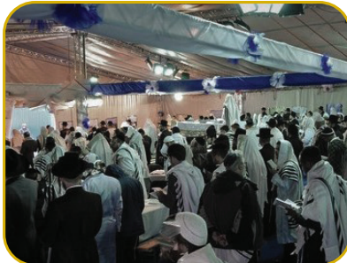
קלטת שיש מלך. הכנסת אורחים באומן

ר' יואל, מבקש המראיין של מגזין ניצוץ בשעת הראיון עם החזן הידוע, הפעם אני רוצה לפני שנתחיל בראיון לספר לך סיפור: ישנו בחור מבורז פארק, שאני מלווה אותו כבר מספר שנים. אותו בחור נולד עם רקע משפחתי כאוב מאד, מה שבין היתר הוביל אותו לנישואין כושלים וגירושים קשים, וטעם בחיים לא נשאר לו הרבה, ומי מדבר על רגש רוחני. אבל בסוף שנה אחת הוא מצא את עצמו באומן אחרי דברי שכנוע מצד כמה ממכריו וחבריו, אבל גם באומן הוא לא התחבר. הוא נשרף לתפילת ראש השנה בקליוז של 'שיינר' ולא מצא את עצמו במילות התפילה.