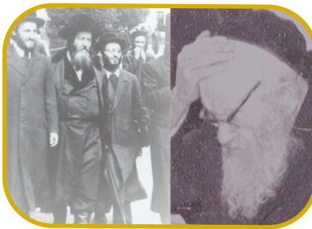
הראון שטינה את העולם: רבי בן ציון אפרט ורבי מאיר שפירא מלובלין זצ"ל

"אל הצעירים החרדים לדבר ה' ותוה"ק בכל ארצות תבל שלום ורב ברכה!, חברי לדעה! הכנסי' הגדולה החליטה – עפ"י הצעת – שיעור הדף היומי. והכל קבלו עליהם החלטה זו שבביעות רצון ושמחה. אבל אתם צעירים, מבחר עמנו ועתידי, קבלתם אותה בהתלהבות קדושה, דעו אפוא בנים חביבים כי נדר גדול נדרתם לאלקי ישראל ועליכם איפה לגשת אל עבודת הקודש ללמוד בעצמכם ולעורר אחרים לזה."