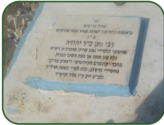
התגלתה אחרי שנים ארוכות. מצבת רבי נתן בן רבי יהודה בטבריה

"תאמינו לי, שבשעת הלימוד ישבתי בגן עדן. וה' יתברך ייתן שיהיה זה הגן עדן שלנו"... כמו כן הוא מעודד אותם לעסוק בספרים קדושים אלו הממתקים את מרירות העולם הזה.