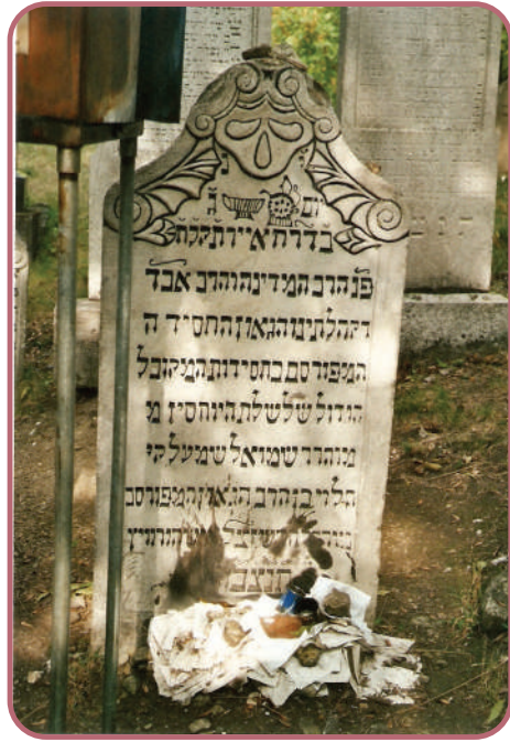
פסוק מפתיע. צילום רבי רבי שמעלקא

עוד בזה העולם, עליי לאסוף זכויות רבות ולתת צדקה בכל כוחי כדי לשגר לעולם העליון זכויות רבות ככל האפשר".