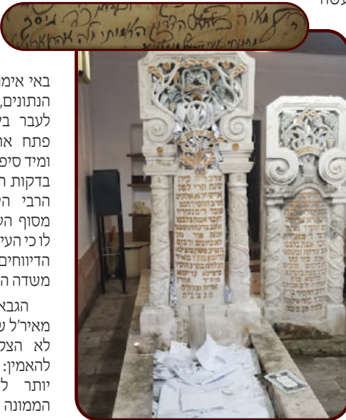
עינים צופיות. מצבתו וחתומתו של רבי מאיר