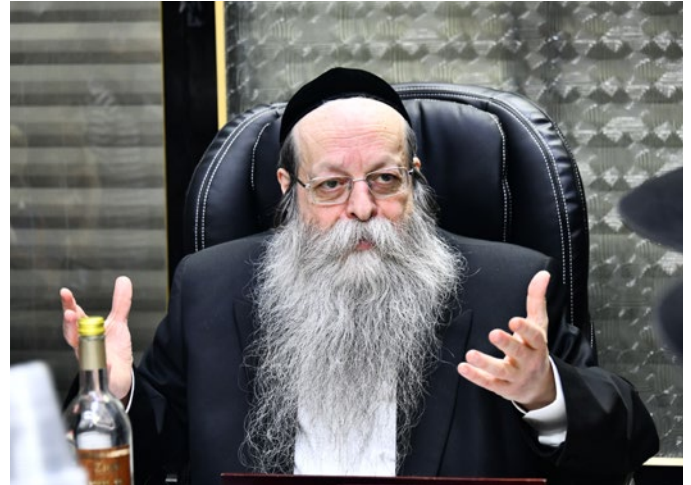
וְהַדָּבָר מְרִים וְאַחֲרָיו בְּמִשְׁחָה (יב א)

התשובה הינה, שהדיבור - יוצר למעשה: 'קשר'. החיבור וההתקשרות בין שני אנשים - יכולים להתבצע רק על ידי דיבור: כששני אנשים מדברים זה עם זה - הם יכולים באמצעות הדיבור להתחבר זה לזה, להבין זה את זה, להכיר זה את זה, וכן הלאה. ולעומת זאת, כאשר חס וחלילה מתגלע סכסוך בין שני אנשים - בראש ובראשונה הם מפסיקים לדבר... כאשר אין ביניהם 'דיבור' - המשמעות הינה שאין ביניהם 'קשר', שכן דיבור - מייצג את הקשר והחיבור.