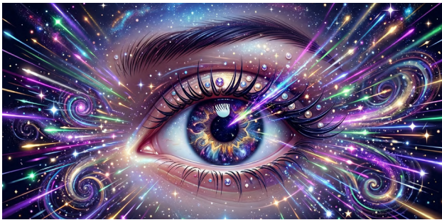
ומבִּשְׂרֵי אֶחְזָה אֱלֹהִים (איוב ט)

נסה לדמיין: עבודה עשרים וארבע שעות ביממה.. בלי חופשה. בלי מנוחה של דקה, כמה זמן היית מחזיק מעמד? יום? שבוע? חודש? כאשר אדם קונה מכונה שעובדת שנה שלימה ללא תקלה - הוא מתפעל ממנה. כשמכונת גומעת מאות אלפי קילומטרים בלי לראות מוסך - כולם עומדים משתוממים. מכונת כביסה שמחזיקה מעמד עשר שנים, הוא מספר עליה לכולם בהתפעלות עצומה. כעת , עצור לרגע התבונן בעין שלך. איבר זעיר, בקוטר של כשני סנטימטרים בלבד, שפועל ללא הפסקה במשך עשרות שנים. בכל שנייה העין קולטת מיליוני פרטי מידע: צבעים, מרחקים, תנועה, אור וצל. היא מתמקדת בעצם קרוב, ומיד אחר כך בעצם רחוק, בתוך שברירי שנייה. העין הממוצעת יכולה להבחין בכ 10 מיליון גווני צבע שונים.