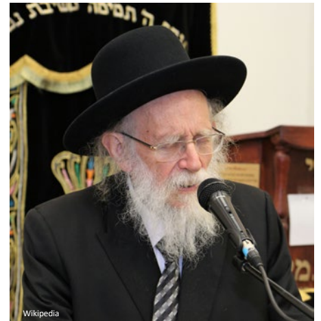
אם חפץ פנו ד' (יד)

מסרוה לאנשי כנסת הגדולה, ומשם לכל יהודי באשר הוא, יש לו את התפקיד להמשיך את הלא ימושו וכאן השאלה המוטלת עלינו לבחור ולהחליט שאנחנו נהיה חלק מזה, ובנו יתקיים הלא ימושו מפ"ך ומפי זרעך. יש מדרש נפלא, הגויים אומרים לכלל ישראל בכל מיני פיתויים לעזוב את התורה הקדושה ואנו אומרים להם שהם לעולם לא יוכלו לנו, ולמה, כי לנו יש את ה'למשפחותם לבית אבותם', אנחנו ממשיכים את מה שקיבלנו מאבותינו ואבות אבותינו.