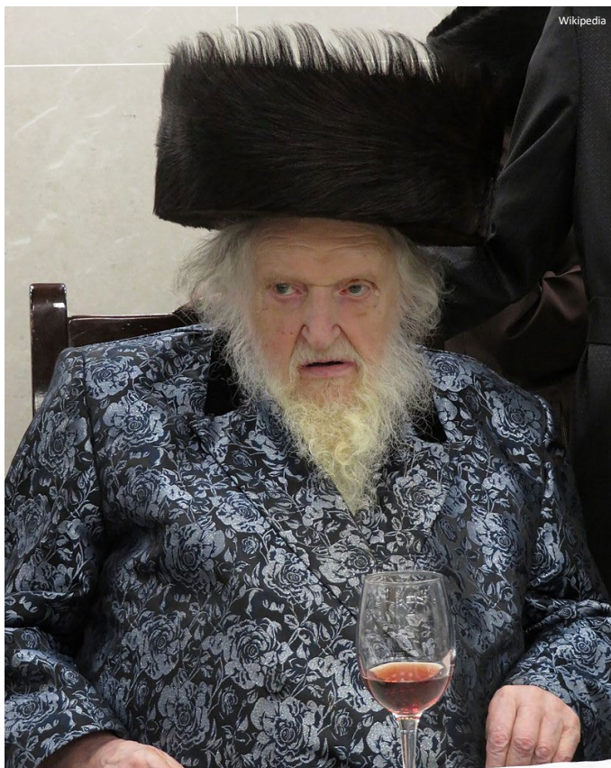
ונבאר כמה רמזים במצה

שְׁבַעַת יָמִים מִצּוֹת הָאֶבֶל (שמות י"ב)